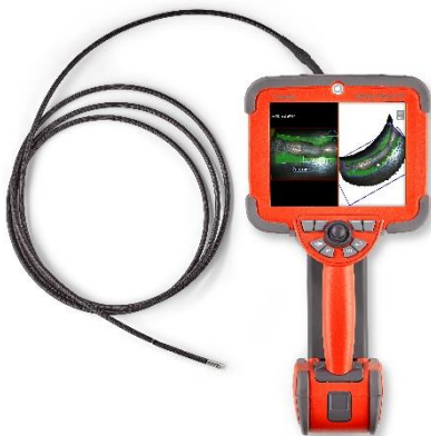
Everest Mentor Visual IQ